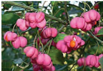
Fusain commune, Pfaffenhütchen * (Euonymus europaeus)