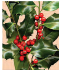
Houx, Stechpalme ** (Ilex aquifolium)