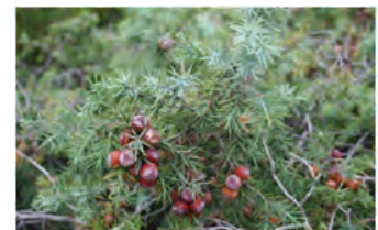
Genévrier sabine, Sadebaum * (Juniperus sabina)