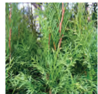
Thuya, Lebensbaum * (Thuja occ. et orient.)

Pour de plus amples renseignements, veuillez consulter :