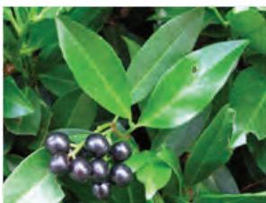
Laurier, Kirschlorbeer * (Prunus laurocerasus)