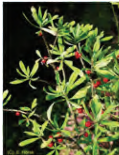
Sainbois, Seidelbast ** (Daphne mezereum)