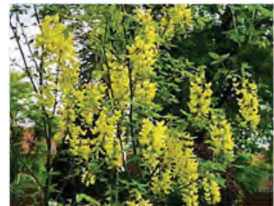
Cytise, Goldregen * (Laburnum anagyroides)