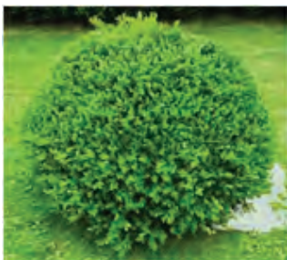
Buis, Buchsbaum * (Buxus sempervirens)